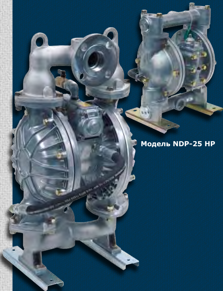
Модель NDP-25 HP

Двухстороннее всасывание с двухсторонним или односторонним нагнетанием, одностороннее всасывание с двухсторонним нагнетанием.